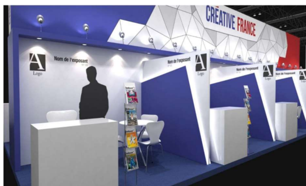
Illustration du design du Pavillon France